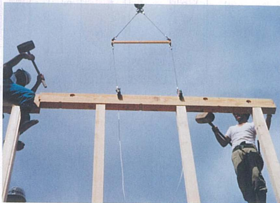
▲木質梁の吊り上げ