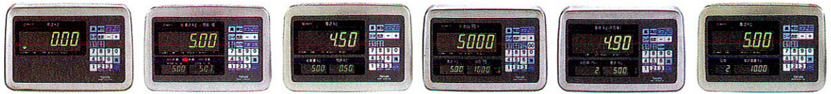
標準タイプ (5501) 上下限判別タイプ (5502) 総重量/風袋/正味重量タイプ (5503) 料金はかりタイプ (5504) 水引機能タイプ (5505) 累計表示タイプ (5506)