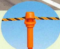
ロープをかけた状態