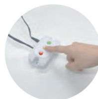
ボタンを押すだけ