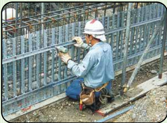
④PFバタ取付・PFナット締付