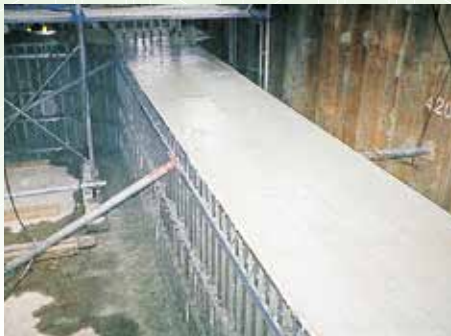
ボックスカルバート裏込め型枠