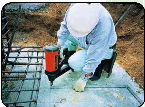
① PF下ランナー コンクリート釘止め