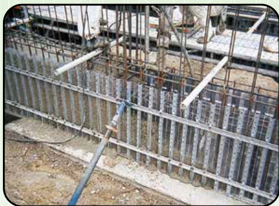
⑧ コンクリート打設