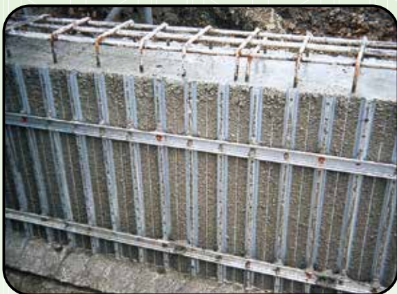
⑨コンクリート打設完了