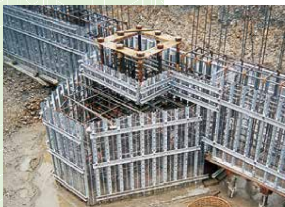
柱まわり・フーチング