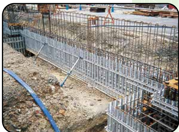
⑥ PFバタ取付・PFナット締付 ⑦ 通り出し・建入れ調整