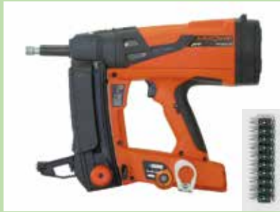
ガス式釘打ち機（専用ピン）