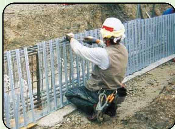
② パンチングフォーム準備 (パネル連結、曲げ加工等) ③ パンチングフォーム配置