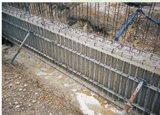
コンクリート打設完了