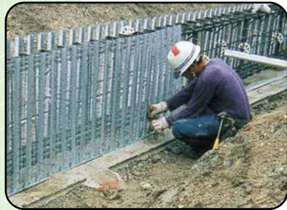
⑤返し側パンチングフォーム仮止め