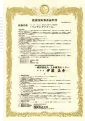
建設技術審査証明事業 (土木系材料・製品・技術・道路保全技術) 建技審証 第0602号 (一財)土木研究センター 有効期限 2026年10月31日