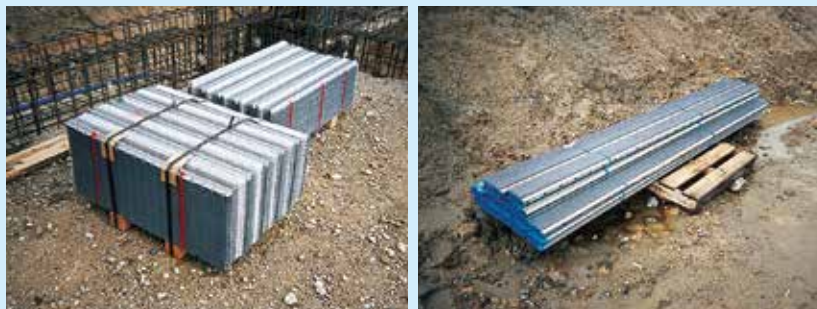
パンチングフォーム・PFバタ梱包状況