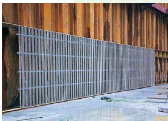
連続壁用裏込め型枠