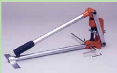
ダクター専用穴あけ工具 MAKD