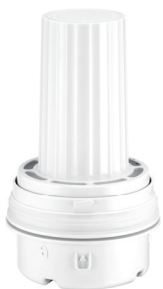
フィルターカートリッジ

フィルターカートリッジに高性能イオン交換樹脂を使用。水道水に含まれるカルシウム成分によるホワイトダストの発生を抑制します。