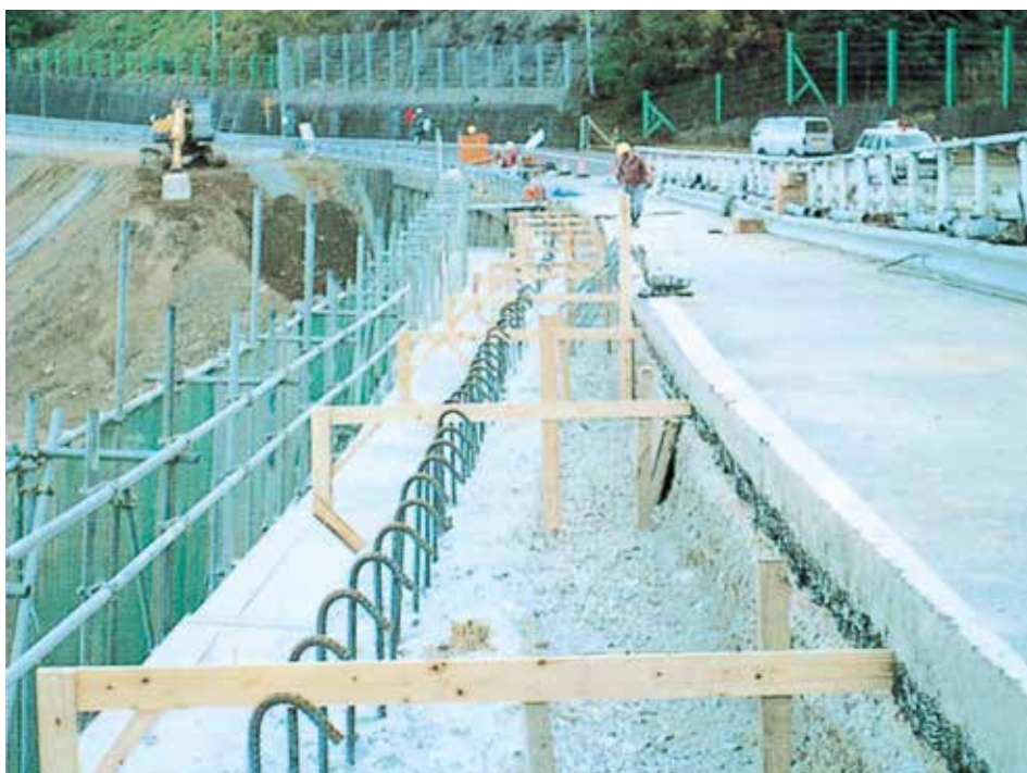
▲コンクリートのかさ上げ