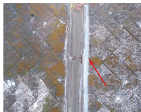
▲目地欠損部の角欠け補修