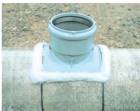
▲ヒューム管と塩ビ支管の固定