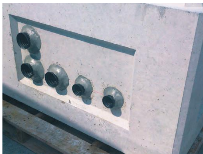
▲樹脂製配管を所定の位置にWKで固定