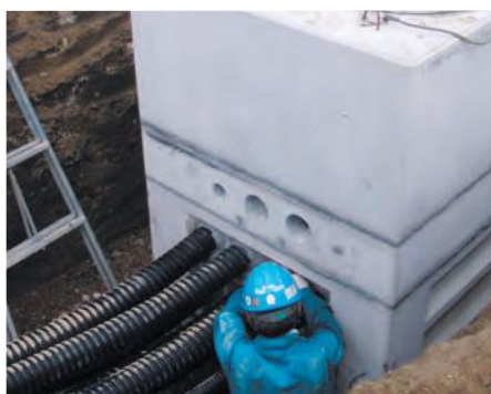
▲ハンドホール横穴と樹脂製配管の固定