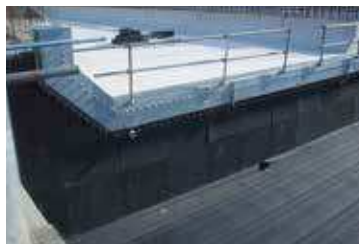
▲空港構造物の緩衝材に使用