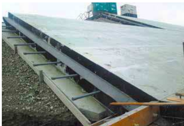
▲防潮堤の目地に使用