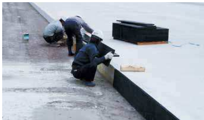
▲空港舗装の目地に使用