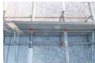
▲舗装膨張目地に使用