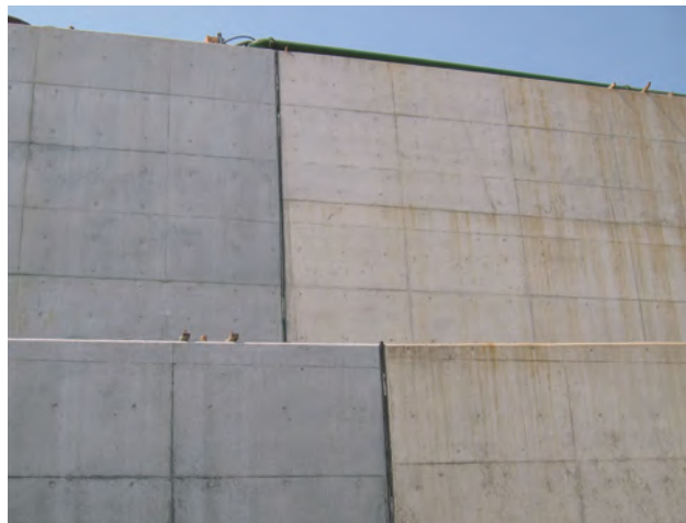
▲地下構造物の目地に使用